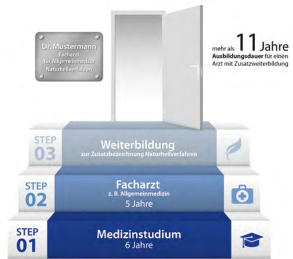
Abb. 4 Integrativ arbeitende ÄrztInnen sind hoch qualifiziert

Diese „doppelte“ ärztliche Kompetenz stellt sicher, dass auch dann, wenn in interdisziplinären Teams gearbeitet wird (stationär wie ambulant), wirksame und nebenwirkungsarme Verfahren und Arzneimittel der Komplementärmedizin in ärztlicher Gesamtverantwortung zum Einsatz kommen.