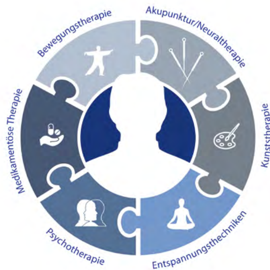
Abb. 7 Beispiel einer integrativen multimodalen Therapie bei Chronischen Rückenschmerzen

Zur Anwendung kommen neben konventionellen Therapiebausteinen aktivierende und übende Verfahren zur Schmerzbewältigung und zur Optimierung der Körperwahrnehmung und Beweglichkeit (z.B. Meditation, Kunsttherapie, Qigong). Therapieverfahren zur Aktivierung der körpereigenen Schmerzhemmung (Akupunktur, Neuraltherapie) werden ergänzt um das Erlernen nebenwirkungsarmer Selbstbehandlung mit Wickeln, Güssen und Akupressur. Zur Vertiefung des Erlernenen und zur Motivation langanhaltender Übungspraxis werden nach einer vierwöchigen intensiven Phase weitere Module angeboten.