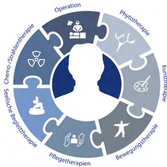
Abb. 6 Beispiel Integrativer multimodaler Therapie bei Brustkrebs