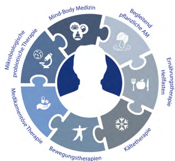
Abb. 5 Beispiel Integrativer multimodaler Therapie bei Rheuma

Gute Studien gibt es zu der seit Jahrzehnten erfolgreich angewendeten Ernährungstherapie und zum Heilfasten. In der Regel werden begleitend Arzneimittel aus der Pflanzenheilkunde, der mikrobiologische Therapie und der Anthroposophischen Medizin eingesetzt. Dazu kommt die Kältebehandlung aus der Thermo-therapie, Elemente der Ordnungstherapie, Mind-Body Medizin und Bewegungstherapie. Mit diesem für die Komplementärmedizin typischen multi-modalen Therapieansatz, kann es gelingen, den Bedarf an Analgetika, nichtsteroidalen Antirheumatika, Cortison etc. gering zu halten.